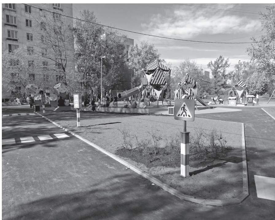
Новая детская площадка у дома 18 по улице Лени Голикова

Кроме того, в программу благоустройства вошли: посадка зеленых насаждений и снос аварийных деревьев, ремонт газонов, набивных покрытий и покрытий из элементов мощения, установка газонных ограждений, замена песка в песочницах, посадка цветов в вазоны, размещение уличной мебели и иные работы.